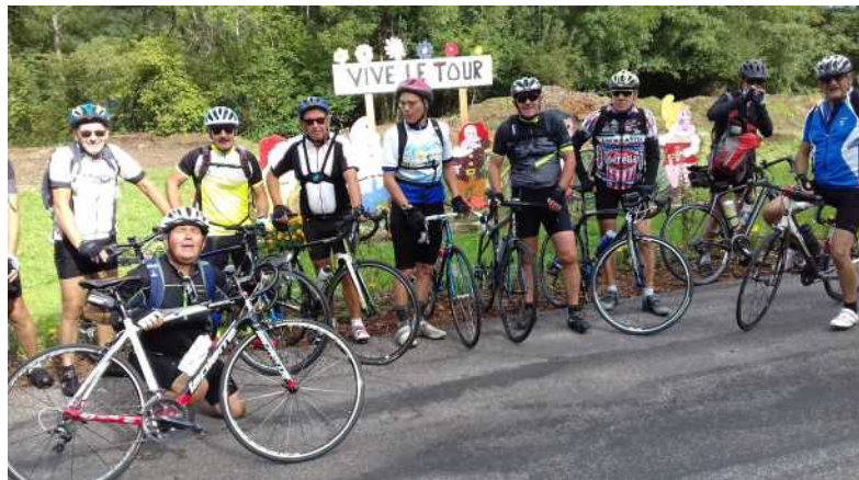
Les mille étangs