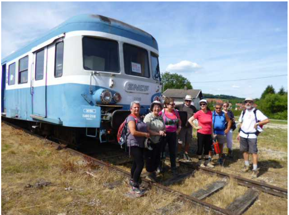
Boucle du Pommeret