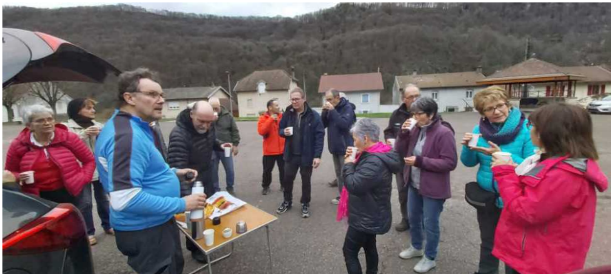
Retour de rando