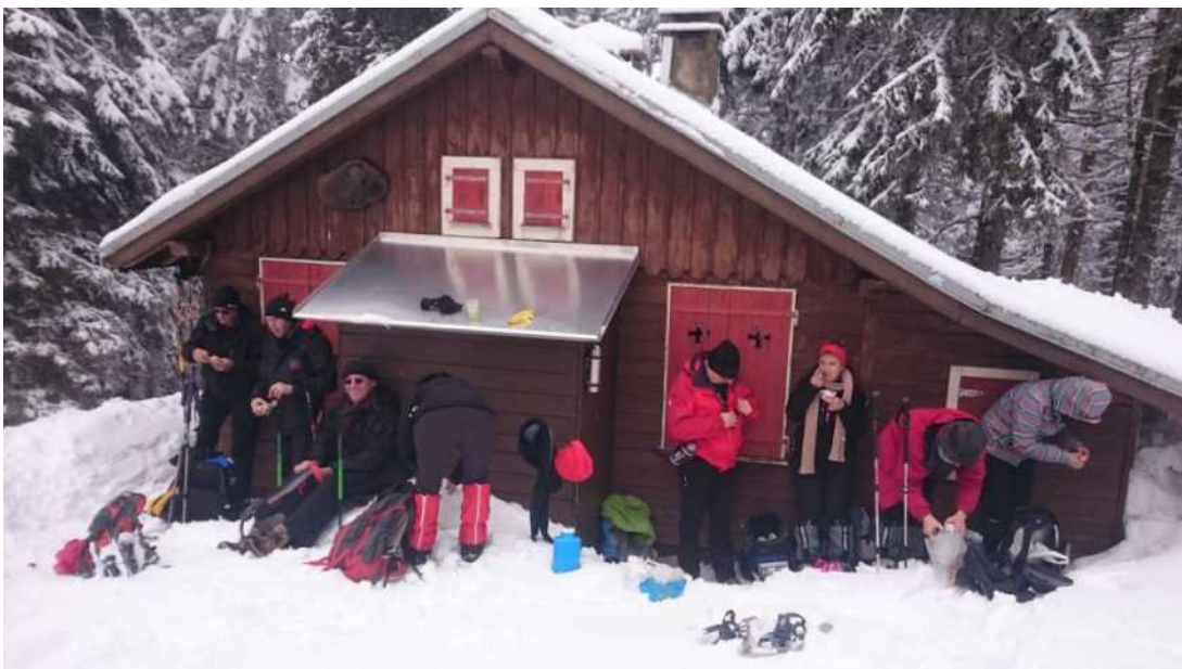
Aiguilles de Baulmes