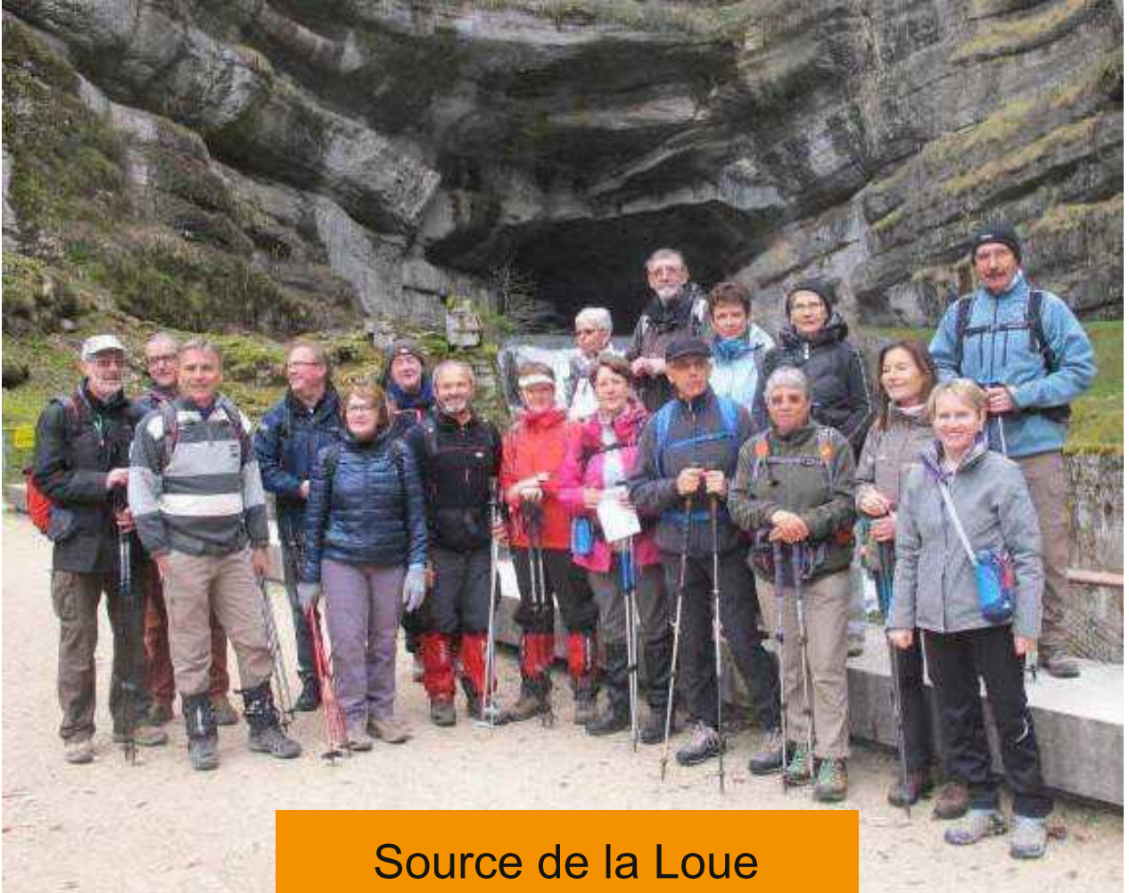
Source de la Loue