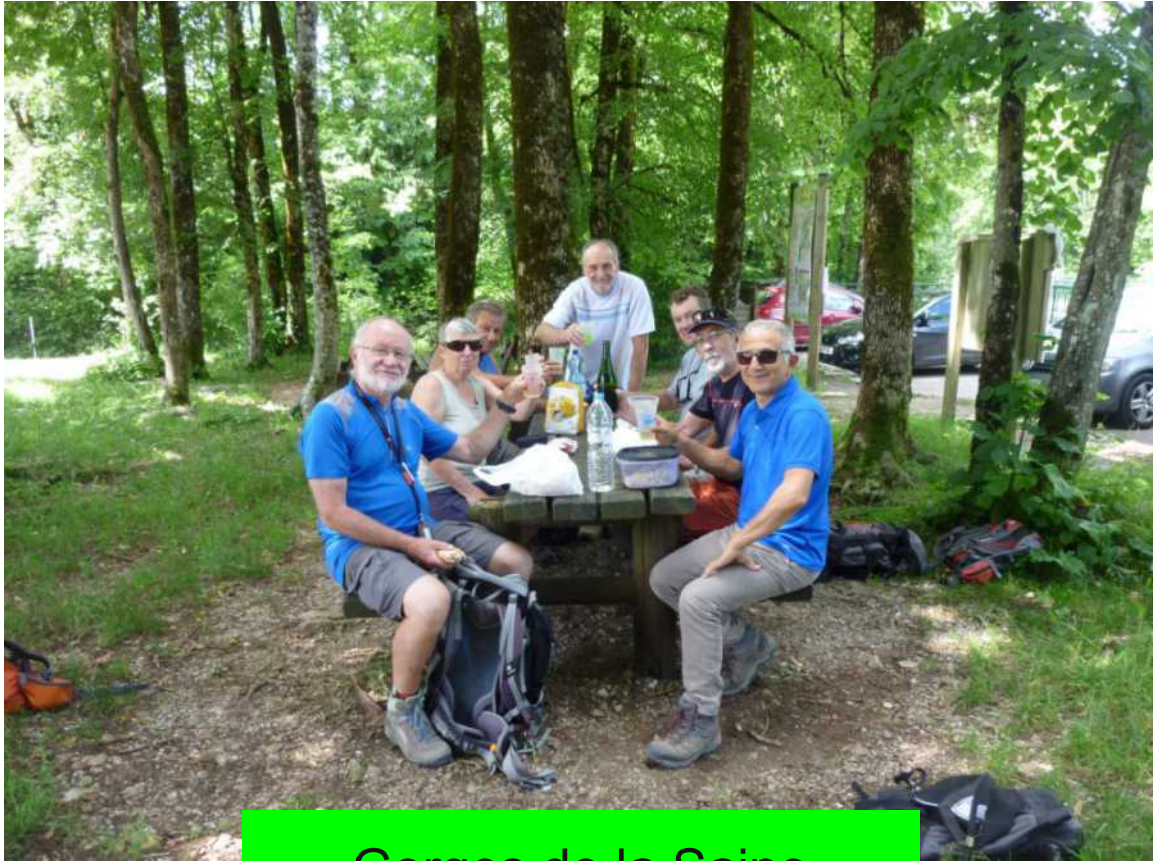
Gorges de la Saine