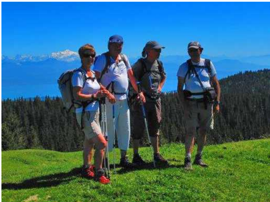
Sur le Mont Tendre