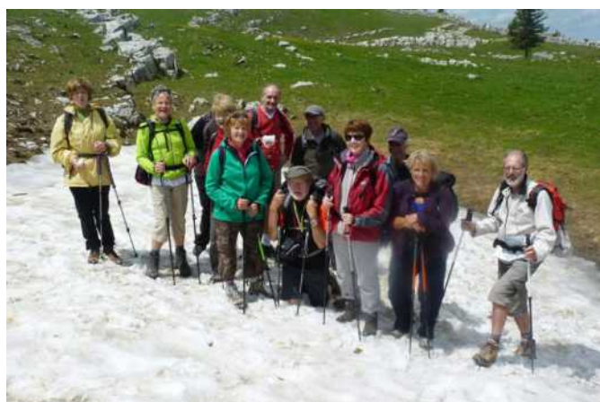
Le Creux du Van