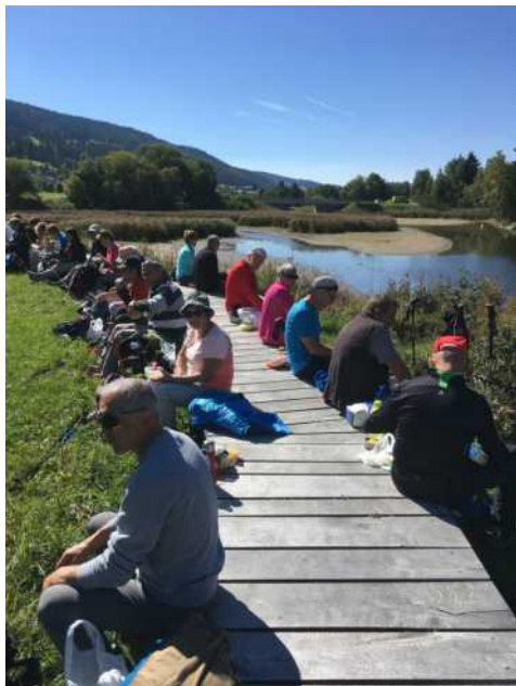
Lac de Joux