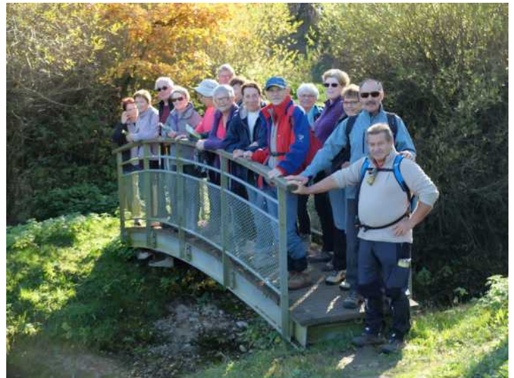
Marais de Saône